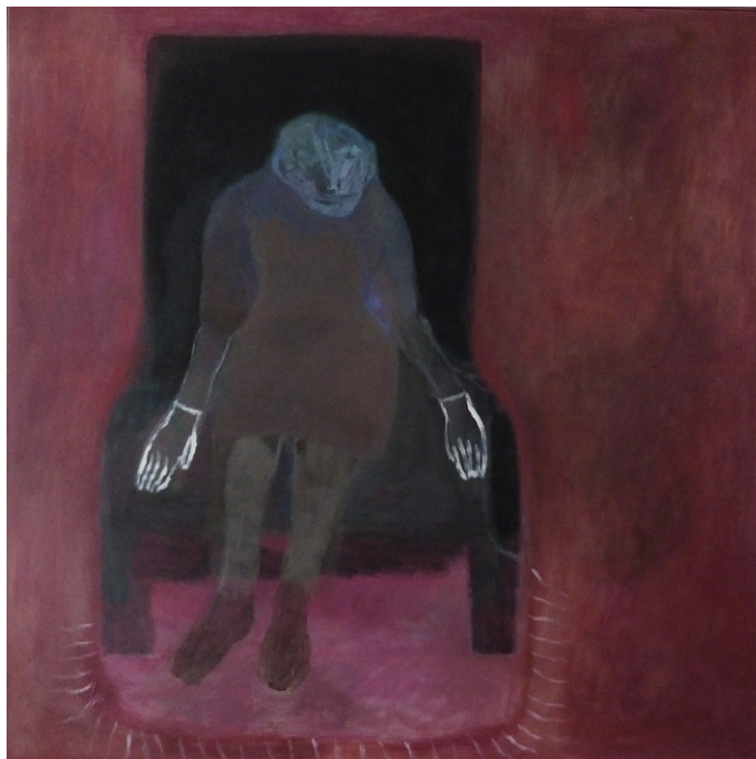
Gitte Boisen, Uden titel, 100 x 100 cm